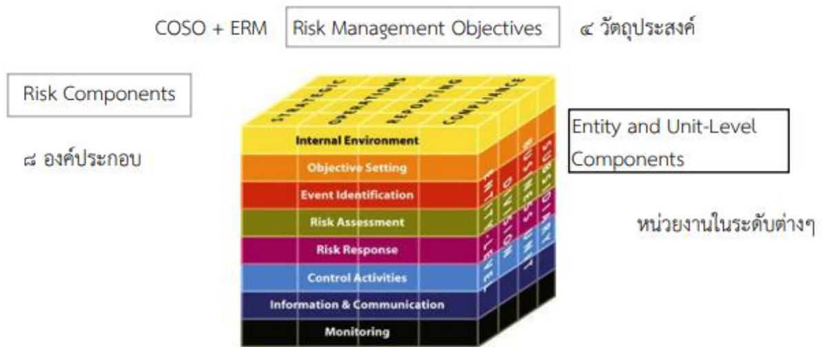
รูปภาพ ๑ องค์ประกอบในการบริหารความเสี่ยงตามมาตรฐาน COSO ERM Integrated Framework

กรอบหลักการบริหารความเสี่ยงแบบบูรณาการตามแนวทาง COSO (COSO ERM Integrated Framework) ดังกล่าว มีองค์ประกอบหลัก จำนวน ๘ องค์ประกอบ เพื่อเป็นกรอบการบริหารความเสี่ยงและการควบคุมภายใน ดังนี้